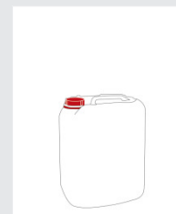
Canister 10 l Art.-Nr.: 2000007