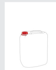
Canister 10 l Art.-Nr.: 2005309