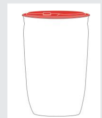
Vat 120 kg Art.-Nr.: 2005308