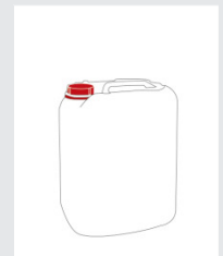
Canister 25 kg Art.-Nr.: 2000568