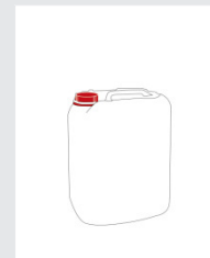
Canister 5 l Art.-Nr.: 2000770