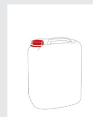
Canister 25 kg Art.-Nr.: 2000568