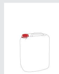
Canister 10 l Art.-Nr.: 2000272