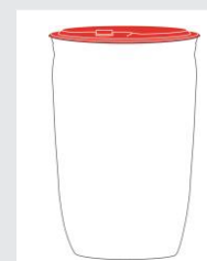
Vat 120 kg Art.-Nr.: 2000393